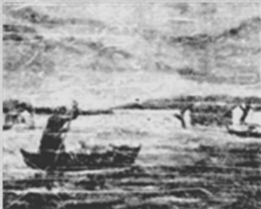
Inundații în Delta